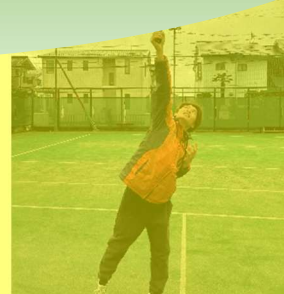
ポイント② インパクトのコツ

準備は左手を上げて左手の外側からボールを見ると身体を横向きにしやすいです。背筋も伸びて良い体勢を作れます。