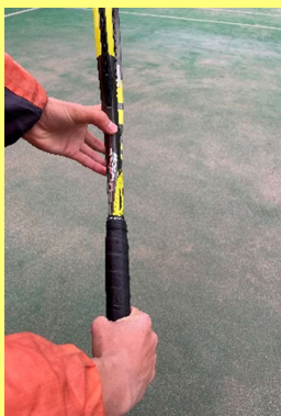
ポイント③ スライスロブ

グリップはコンチネンタルです。打点は少し低めの方が打ちやすいのでフラットサーブ時のレシーブやラリーの展開を変える時などに使えます。打ち方はボールの少し下から入り、打ちたい場所へ運んで上げるイメージでフォロースルーをします。