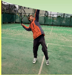
ポイント① フォームの作り方

準備は左手を上げて左手の外側からボールを見ると身体を横向きにしやすいです。背筋も伸びて良い体勢を作れます。