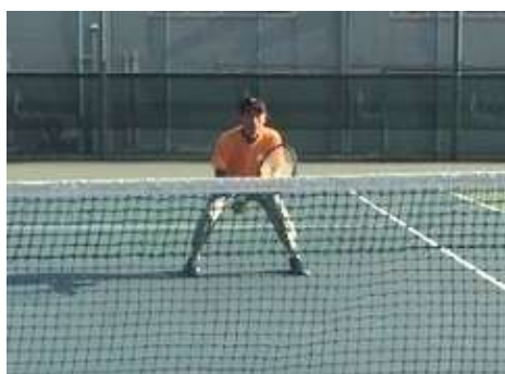
ワイドスタンス & 低い姿勢