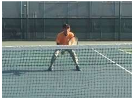
ワイドスタンス & 低い姿勢