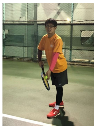
【左に狙う体の向き】