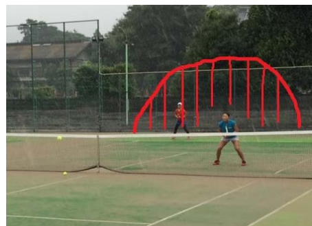
危険な空間は意外と狭い

コスモテニスカレッジでは毎月テーマを決めてレベル別にレッスンを行っています。 テーマはW（ホワイト）を除くすべてのレベルで共通ですが、レベルによって難易度が違います。 1～2週目は基本的な内容が中心となり、3～4週目はより高度な内容になります。 テーマが決まっているからと言ってレッスン中ずっとテーマばかり行うわけではありません。 テーマを設けることで分かりやすいレッスンを提供する事が目的です。