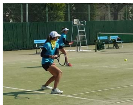
コンパクトなテイクバック